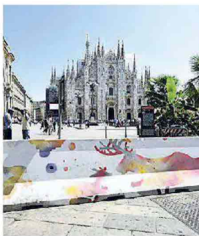
Milano, barriere al Duomo

riere, sulla Darsena e i Navigli e a corso Como, vicino alla torre Unicredit. L'amministrazione comunale ha poi lanciato un appello ai writer milanesi per colorare le barriere di cemento per renderli meno antiestetici, anche se l'idea resta quella di sostituire i new jersey con dei dissuasori di altro tipo: ad esempio i piloni uniti da catene d'acciaio collocati sul lungomare di Nizza dopo l'attentato del luglio 2016, che sono in grado di frenare la corsa dei tir. E c'è anche chi, come l'architetto Stefano Boeri, propone